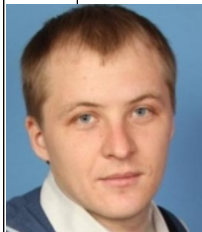
( ) - « » .