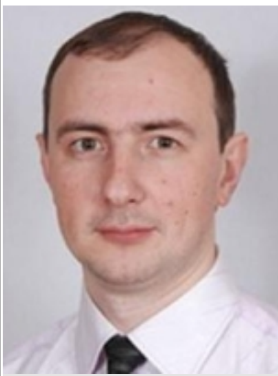
— , . . . , « ».