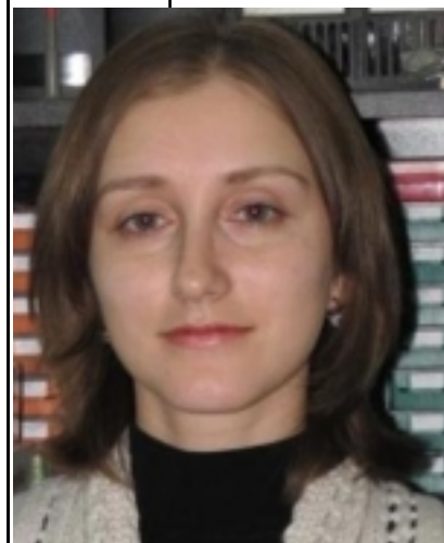
( ) - . . . , « » .