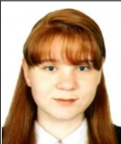
- ( ) -- « » .