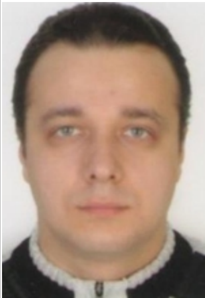
() - . . . , « ».