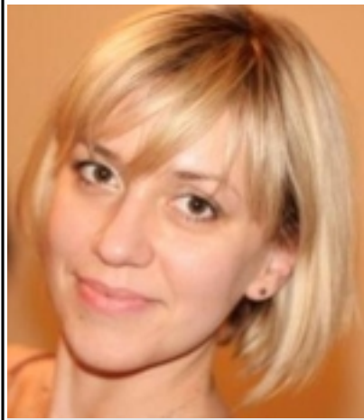
() - « ».