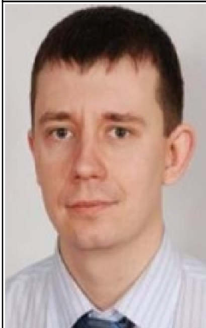
— , . . . , « ».