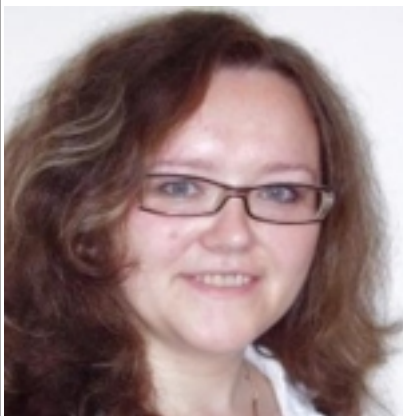
() - . . . , , « ».