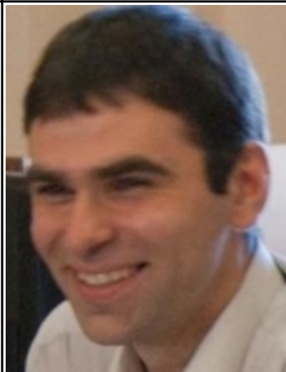
() - . . . , « ».