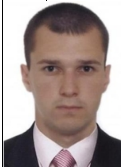
() — . . . , « , ».