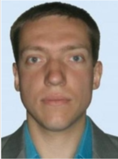
() - . . . , « ».