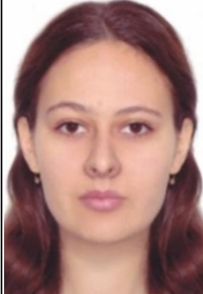
() - «- ».