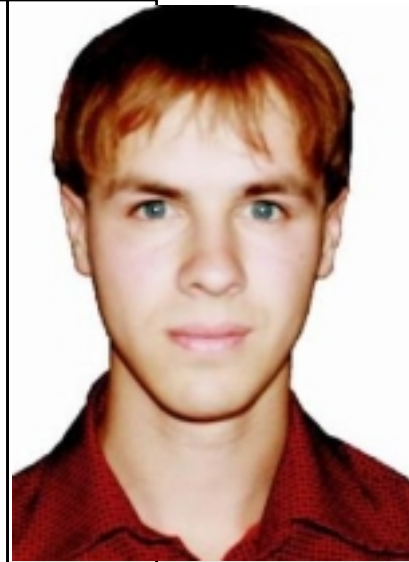
() - « ».