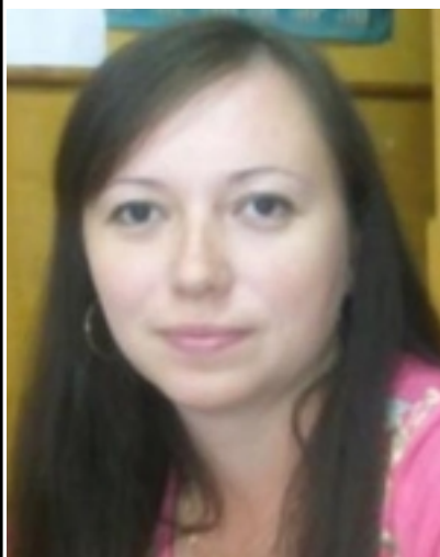
- () - . . . , « ».