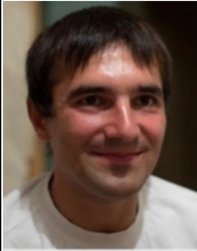
— « ».