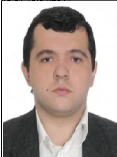
— , . . . , « - » , .